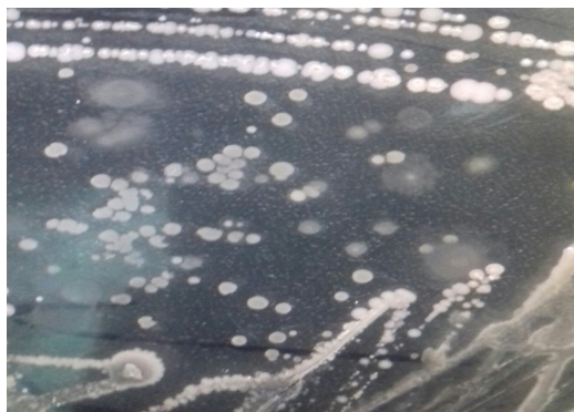
Рис. 2. Ріст колонії Pseudomonas spp.

розщеплює крохмаль, глікоген. Дослідженнями було виявлено, що колонії сухі, дрібнозморшкуваті, бархатисті, безбарвні або рожеві. Краї колонії були хвилясті, коралоподібні.