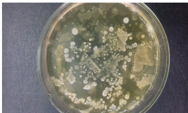
Рис. 3. Ріст кокової мікрофлори у первинному посіві

Серед висіяного матеріалу було ідентифіковано значну кількість Pseudomonas spp. Псевдомонади найменш вибагливі до факторів росту. Вони метаболізують складні органічні речовини і легкозасвоювані вуглеводи. Важливою діагностичною ознакою бактерій є їх здатність утилізувати вуглеводи як джерело живлення і енергії. Базовим вуглеводневим субстратом служить глюкоза. Pseudomonas spp. грам-негативні паличковидні бактерії розміром близько 0,5-1,0x1,5-5,0 мкм, аероби, вони є дуже різноманітні за типом метаболізму, і тому можуть колонізувати широкий ряд екологічних ніш. Pseudomonas spp. мають здатність метаболізувати різноманітні поживні речовини. Колонії були різної форми: плоскі неправильної форми, великі опуклі блискучі, слизові, карликові або точкові, складчасті. Мали сіре або жовтувато-сіре забарвлення, слабо опуклі, маслянистої консистенції.